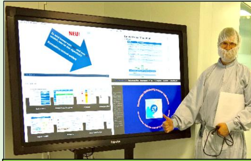
INFO HUB MASTER/SLAVE